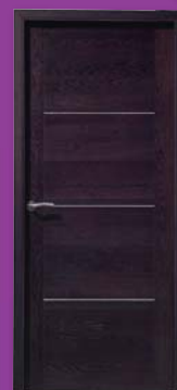
Alizé Chêne Wengé brossé