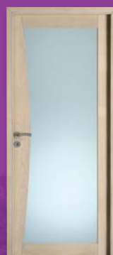
Tramontane vitrée dépoli Chêne blanchi