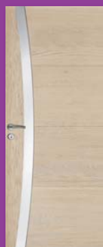
Sirocco Chêne blanchi