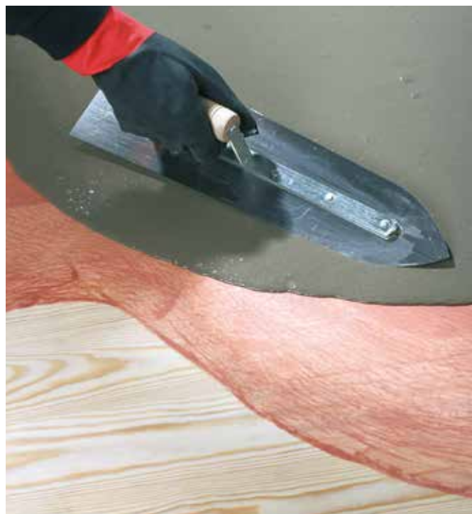
Sur bois associé aux primaires CERMIGRIP ou CERMIPRIM RAPID